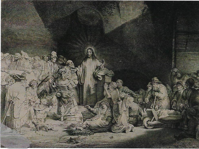
“병자를 고치는 예수 그리스도” (렘브란트 반 레인, 에칭, 1649년, 영국 웰컴 라이브러리 소장)